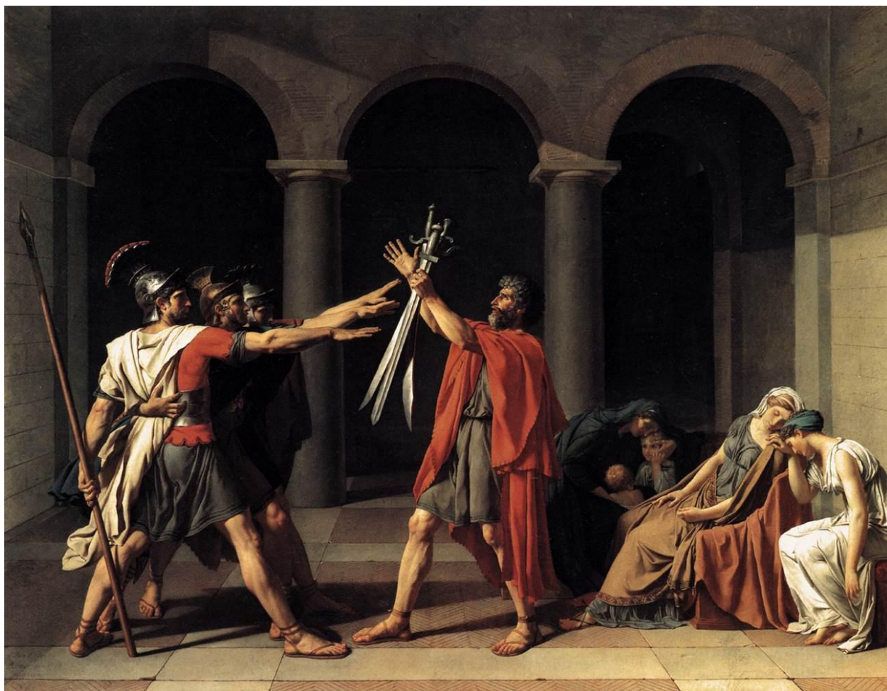
Фиг. 1. Жак-Луи Давид - „Клетвата на Хорациите“