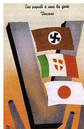
Фиг. 8 и 9. Пропагандни плакати с главно V. Надписът на десния гласи „Три народа и една вяра – победата!“

От фашистите също така е експлоатиран и келтският кръст, но той не е свързан с римското наследство.