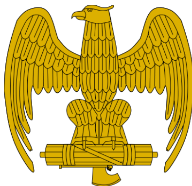
Фиг. 6 и 7. Знаме на Италия от 30-те г. с орел, държащ в ноктите си ликторски сноп