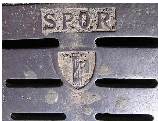
Фиг. 5. SPQR на канализационна шахта в Рим от времето на Мусолини